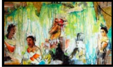
Artiste : Sébastien Gaudette