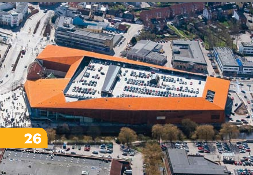
Centre commercial Bryggen, Vejle (Danemark), schmidt hammer lassen architects et 3xN.

Même au royaume du design, il reste du chemin à faire. ☹