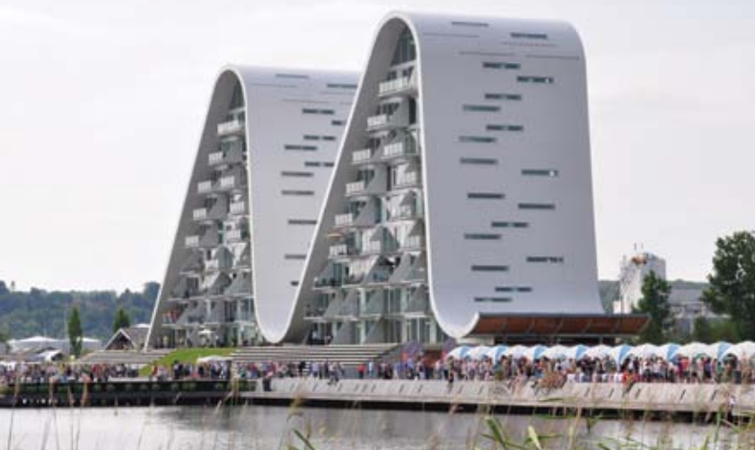
The Wave, immeuble résidentiel, Vejle (Danemark), Henning Larsen Architects.